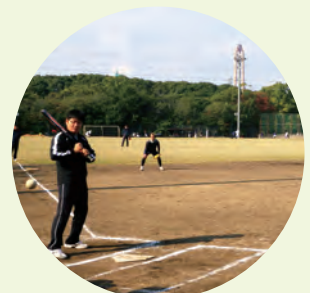
ソフトボール大会